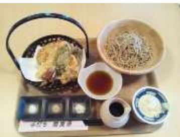
天もりそば (税込1,150円)